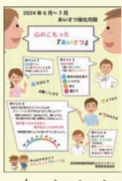
キャンペーン強化月間のポスター

主な活動内容として、院内・外講習、講演会の開催運営、QC活動（Quality Control：品質管理）発表会の開催運営、職員教育に関すること、個人の能力に関することを行っております。院内・外講習では、イーラーニングにて感染管理・医療安全・個人情報・医療機器・サイバーセキュリティ・接遇など様々な講習を行っております。職員教育に関することでは、BLS研修（心肺停止または呼吸停止に対する一次救命処置）、中堅職員研修、新人研修などを行い、新人研修ではリフレッシュ研修として、リフレッシュを兼ねて院外での研修も行っております。個人の能力では、目標管理シートにて能力向上に努めております。また、今年度からは、東邦病院意識向上キャンペーンと題して、2カ月毎に全職員で様々なテーマを強化して取り組み、より良い医療サービスを提供できるように努めております。