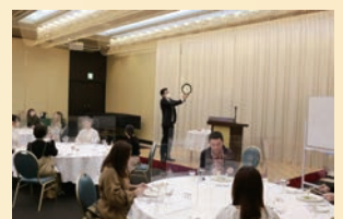
リフレッシュ研修 (テーブルマナー)